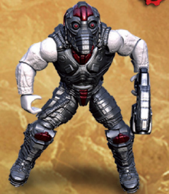
LOCUST DRONE Snub pistol