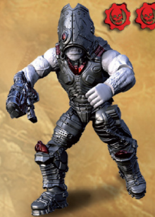
LOCUST CYCLOPS Hammerburst