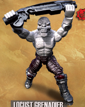
LOCUST GRENADEIER Gnasher Shotgun